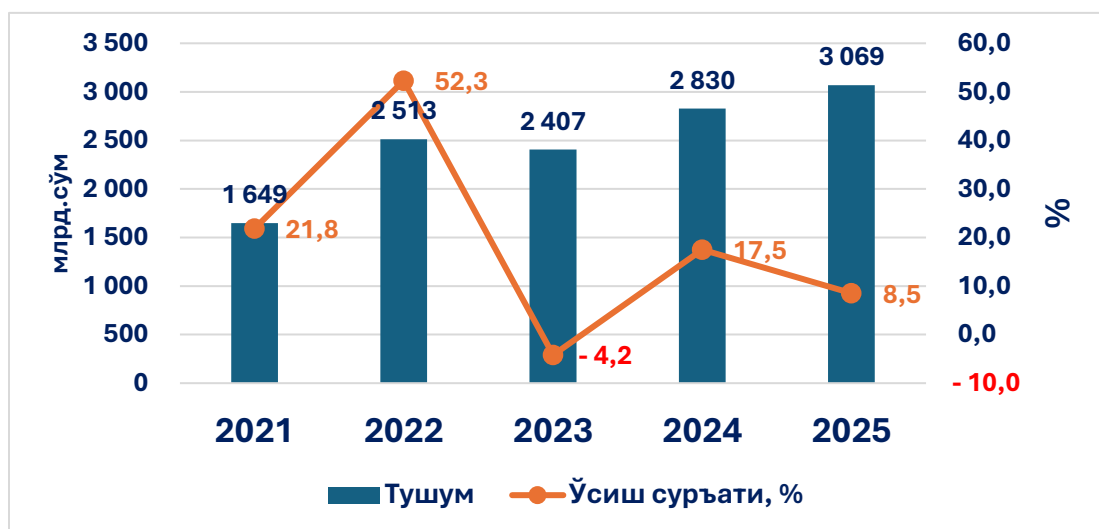
2-расм. Айланмадан олинадиган солиқ тушумлари динамикаси, 2021–2025 йиллар

Келтирилган маълумотлар айланмадан олинадиган солиқ тушумлари ижобий ўсиш динамикаси сақланиб қолаётган бўлсада, ўсиш суръатлари кешбек жорий этилишининг дастлабки йилига нисбатан секинлашиб бораётганлигини кўрсатмоқда. Бу эса солиқ кешбеки учун давлат бюджети харажатларининг ўсиб бориши солиқ тушумларининг мутаносиб равишда ортиши билан бирга кечмаётганини англатади.